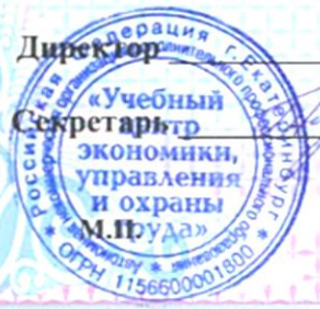
АНО ДПО «УЦ ЭУОТ» по дополнительной профессиональной программе «Профилактика детского дорожно-транспортного травматизма в дошкольных образовательных учреждениях» 18 ак. часов