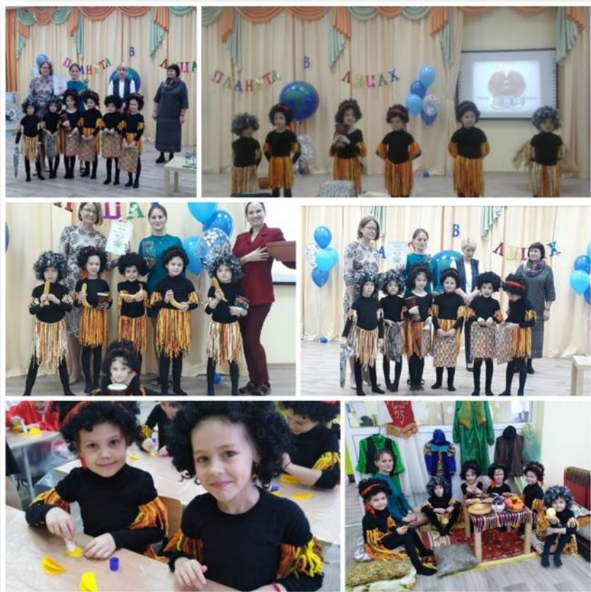
Городской фестиваль «Планета в лицах»