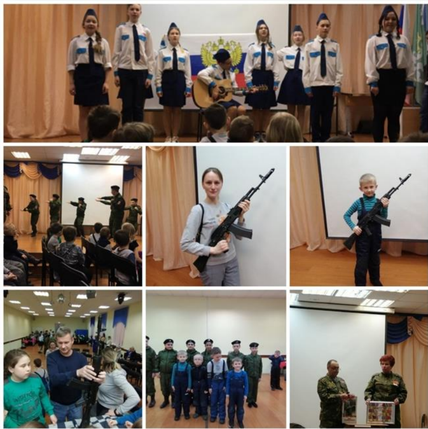
Встреча с юнармейцами патриотического клуба в школе №2