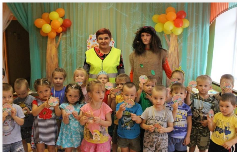
«Посвящение в пешеходы»