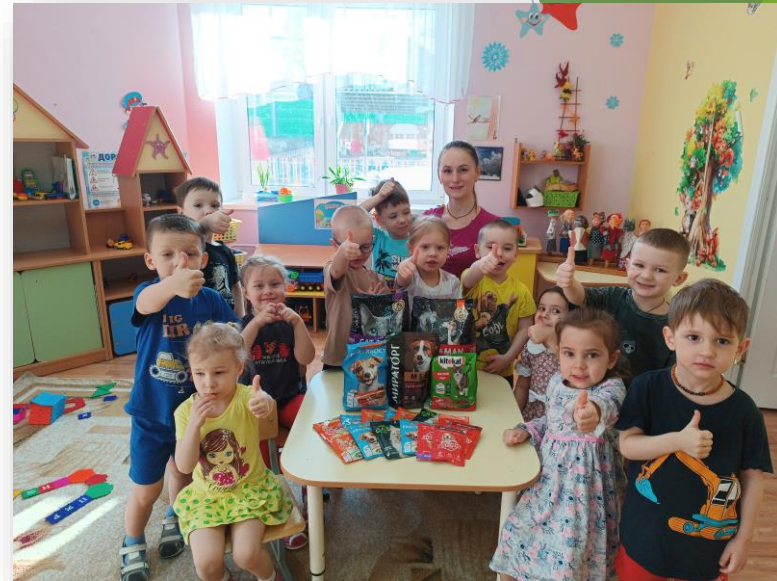
День защиты животных весна