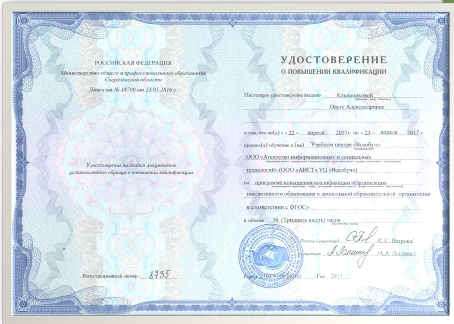
ООО «Аист» УЦ «Всеобуч» «Организация инклюзивного образования в дошкольной образовательной организации в соответствии с ФГОС», 36 часов