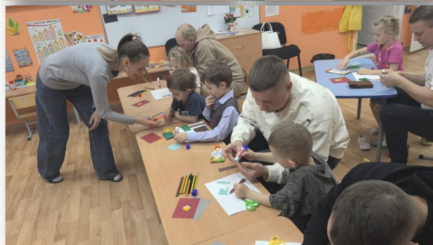
Мастер класс «Вместе с папой» ко Дню отца. 2025г