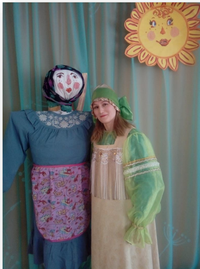
Традиционный праздник «Масленица»