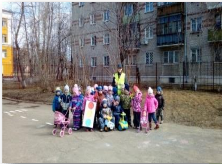
Встреча с инспектором ГИБДД