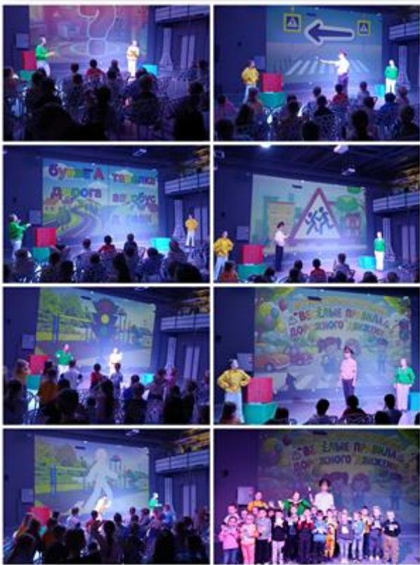
Интерактивная программа «Веселые правила дорожного движения» 2026г